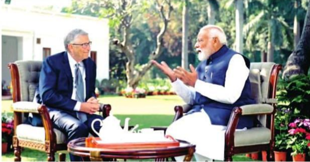
தில்லியில் பிரதமர் நரேந்திர மோடியுடன் வெள்ளிக்கிழமை கலந்துரையாடிய பில்கேட்ஸ்.

பில்கேட்ஸ் உடனான கலந்துரையாடலில் பிரதமர் மோடி